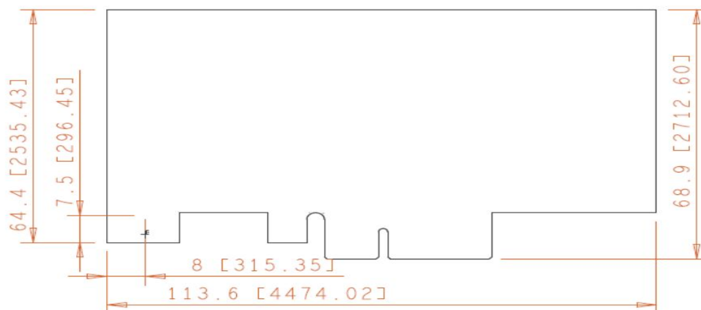
表2 SF400千兆以太网网络适配器尺寸信息